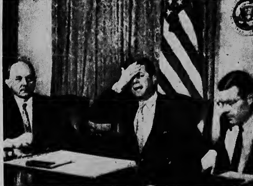
GESTO SIGNIFICATIVO DI PRESIDENT KENNEDY. — E president nobo di Estados Unidos John F. Kennedy a tene na Casa Blanca un conferencia cu Robert McNamara (derecho), ministro di Defensa i Dean Rusk (izquierda), ministro di Asuntonan Exterior, respectu proporcionan politica pa cu Union Sovietica. Manera nos por mira riba e portret, Kennedy ta haci un gesto signifi-

Washington un conferencia cu Robert McNamara (derecho), ministro di Defensa i Dean Rusk (izquierda), ministro di Asuntonan Exterior, respectu proporcionan politica pa cu Union Sovietica. Manera nos por mira riba e portret, Kennedy ta haci un gesto signifi-